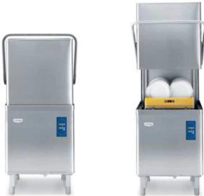
Equipos Electrolux y Champion

Marcas Distribuidas: Electrolux ( http://professional.electrolux.com/ ), American Panel ( http://americanpanel.com/ ), Imperial ( http://www.imperialrange.com/ )